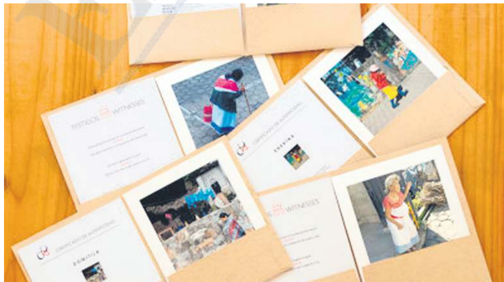
AGRADECIMIENTO. Estas son las fotos que se entregarán a los donantes que aporten dinero para realizar las exposiciones del próximo año.