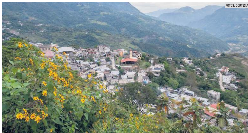
SAN PABLITO PAHUATLÁN. También conocido solo como San Pablito, se encuentra a 209 kilómetros de la capital poblana.