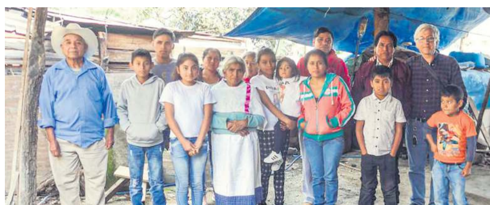
UNIDOS. La comunidad de San Pablito Pahuatlán posa junto al artista Gaal D. Cohen (a la extrema derecha de la imagen, atrás).

Para más información, recompensas por donativos y fases del proyecto "Testigos" en https://igg.me/at/witnesses-testigos y en http://gaalcohen.com