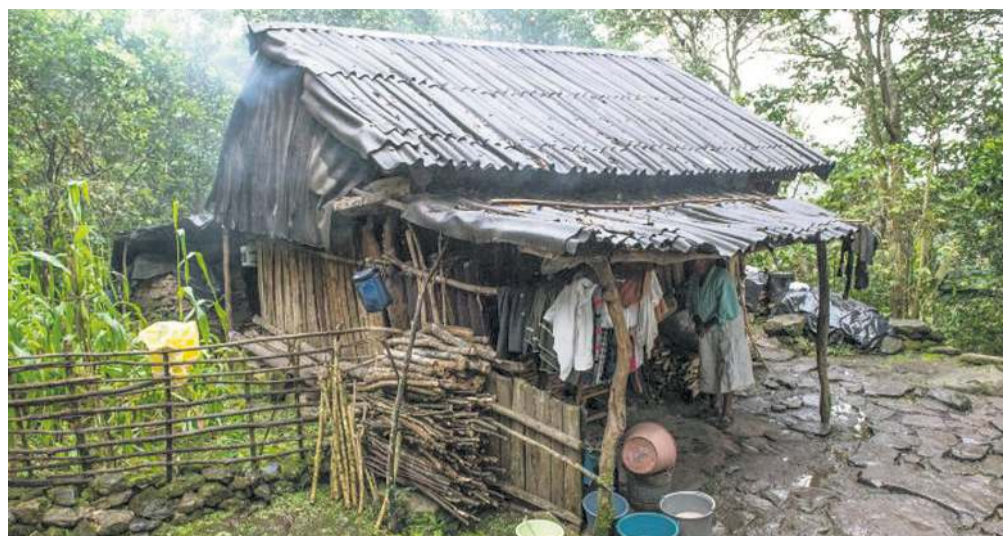
MUESTRA. Aspectos fotográficos de las viviendas que dan color a la exposición.